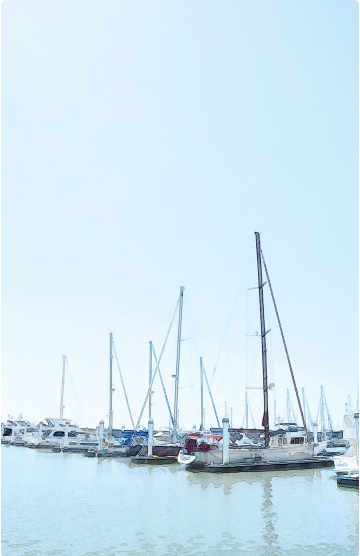
新西宮ヨットハーバー(西宮浜)