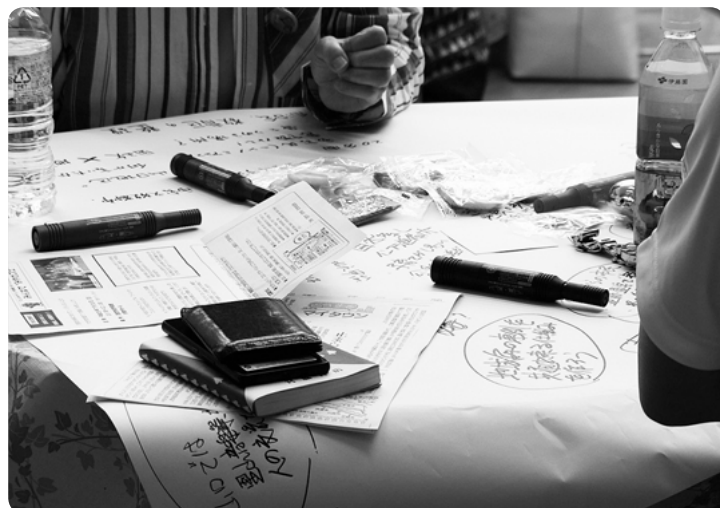
市民ワークショップ「みんなで”みやカフェ”」