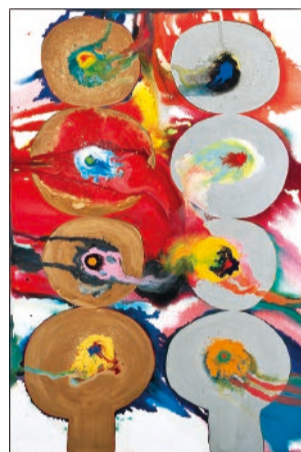
元永定正《作品65-1》1965年 油性合成樹脂塗料・カンヴァス、板

同展覧会では、平成9年(1997年)以降に同館が企画・開催した現代美術作家(16作家)の個展を振り返り、その作品を通して、同館の歩みを紹介しています。