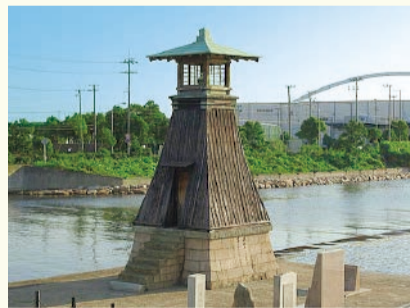
【今津灯台】 (西宮市指定文化財) 樽廻船の出帆地 西宮の今津港の 港に建つ常夜灯。 1810年に創建 (今津西浜町)