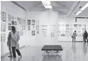
子供から大人まで楽しめます