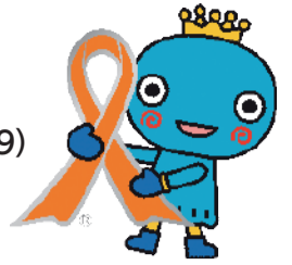
オレンジリボンマークは児童虐待防止のシンボルです

未来へと命を繋ぐ 189(いちはやく) 問 子供家庭支援課(0798・35・3089、3749)