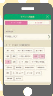
地域×キーワードでの検索が可能に!