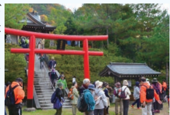
▲にぎわいを見せる「西宮山口アルキナーレ」

これからも、山口で生まれ育った人、新しく住み始めた人、みんなで顔が見える関係を作り、お互いが助け合い、一体となって地域を盛り上げ、住みやすいまちをつくらせていきたいです。