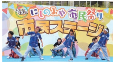
昨年度のステージ

今年の「にしのみや市民祭り」は、10月28日(土)に市役所本庁舎周辺で開催します。にしのみや市民祭り協議会は、同祭りのイベントなどに参加する団体・個人を募集します(下表参照)。なお、今年度から「絵画コンテスト」は実施しません。