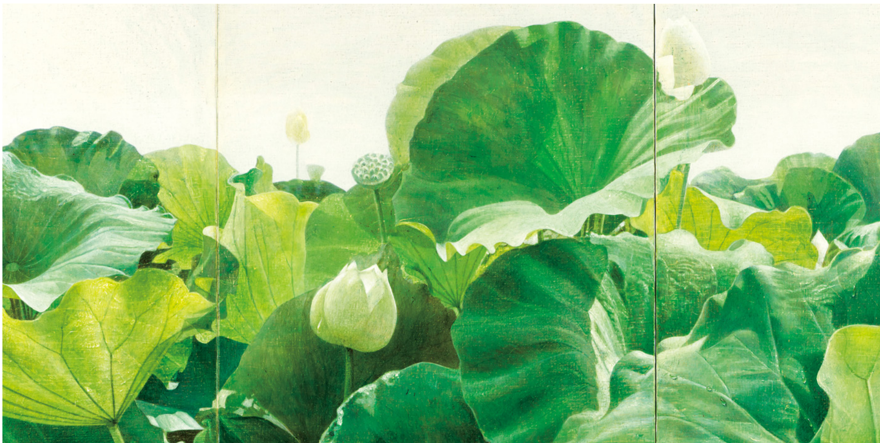
川村悦子《凱風-しろ》2010年(部分) 作家蔵