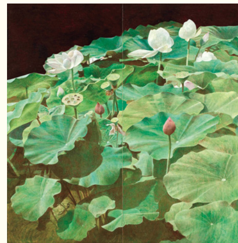
川村悦子《凱風》2011年(部分) 個人蔵