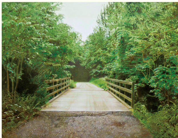
川村悦子《道》2012年 東京オペラシティ アートギャラリー蔵