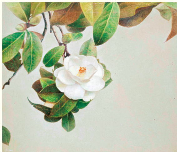
川村悦子《白椿 I》2010年 作家蔵

OTANI MEMORIAL ART MUSEUM, NISHINOMIYA CITY