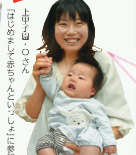
上甲子園・Oさん 「はじめまして赤ちゃんといっしょ」に参加