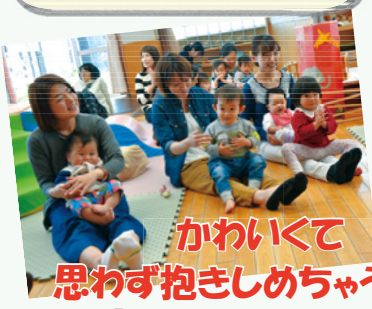
かわいくて 思わず抱きしめちゃう