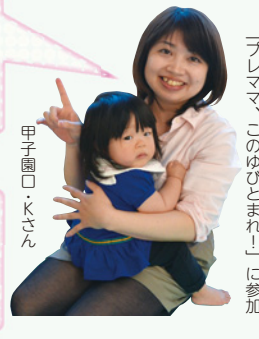
甲子園口・Kさん プレママ、「このゆびとまれ!」に参加