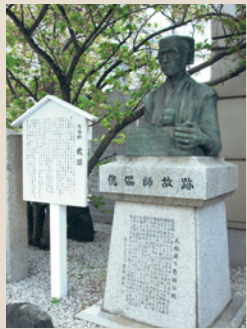
※アクセス…阪神西宮駅から西へ徒歩約3分

神社周辺に住んでいた。彼らは西宮神社に奉仕する一方、小さな人形の入った箱を首から下げた人形芝居をしながら、えびす信仰を伝えるために全国行脚して