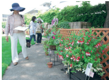
ガーデンコンペの審査風景