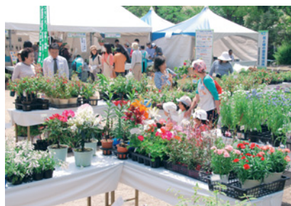
花と緑の市はたくさんの人でにぎわいます