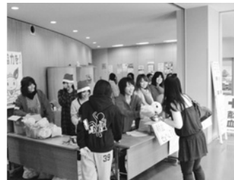
西宮市献血会連絡協議会