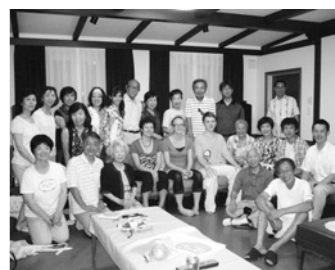
西宮スポークン姉妹都市協会

等、幅広く事業を展開し、伝統・文化の継承と地域福祉の向上に尽力。また、さくらやまなみバスの運行や山口センターの開設に財政面等の支援を行い、公共交通の利便性の向上や地域間の交流促進に寄与するなど、本市の明るく住みよいまちづくりに大きく貢献 西宮市献血会連絡協議会 献血会相互の連絡調整を図り、長年にわたって計画的な献血の推進に取り組み、安全な血液の