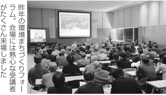
昨年の環境まちづくりフォーラム。会場には熱心な受講者がたくさん来場しました

市は、環境に関するフォーラムや講座を開催します。エコについて考えるきっかけに、皆さんぜひご参加ください。