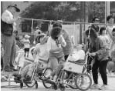
さあ、大きく口を開けて!!-パン食い競争-

「スポーツの秋は地域の運動会です」。気持ちのいい秋空のもと、青葉園では今年も園に通所する通所者一人一人の住むそれぞれの地域の運動会に参加しました。 この運動会参加は、ある地域で15年前に始まりました。 今年も、「緊張しながらも開会式で初めて前に出て挨拶した人」「魚釣り競争で、なかなか釣れず最後まで残ってしまった人」「給食い競争で、顔一杯に小麦粉をつけてあがってしまった人」... 参加した人一人ひとりが秋の一日を満喫した運動会でした。 さあ、大きく口を開けて!!-パン食い競争-