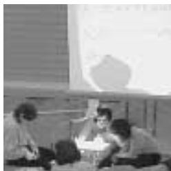
速く、正しく、読みやすく

時間 午後1時~4時 会場 中央公民館 講師 西宮市聴力言語障害者協会難聴部 要約筆記サークル「西宮ペンの会」