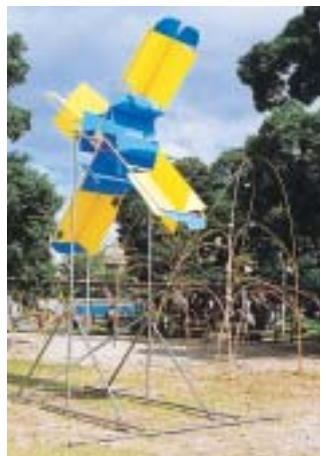
芸術作品を身近なところで楽しむ機会も(アウトドア アート フェスティバルにて)

同ビジョンは、「文化 美しい風 西宮～豊かな文化、豊かな交流、豊かな心のまちへ」を基本理念とし、これまで「文化の街づくりに関する市民意識調査」や「電子会議」、「市民の皆さんのパブリックコメント」などを実施し、「ビジョン策定懇話会」において審議を行ってきました。平成18年度からおおむね10年間を計画期間としています。