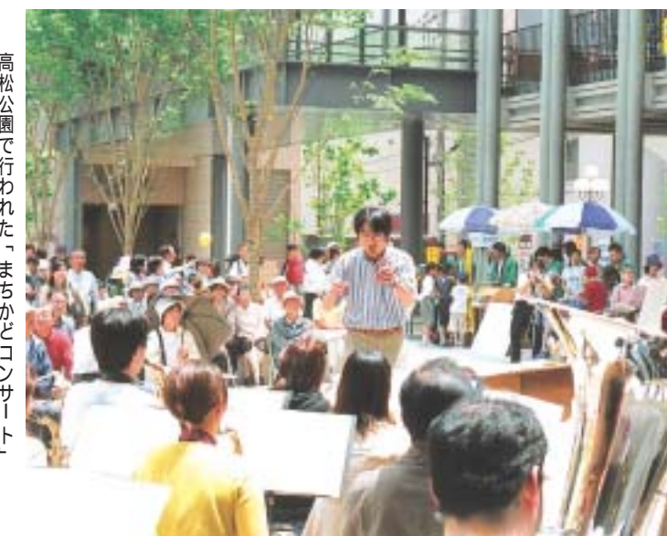
高松公園で行われた「まちかどコンサート」

また、昨年10月にオープンした県立芸術文化センターと連携し、市内を拠点に活動している芸術団体の協力も得て、同センターでコンサートを開催しました。この事業は、市民の皆さんが企画・実施する公募型の文化イベントです。対象はアマチュアの団体・グループで、分野は音楽や演劇、オペラ、パフォーマンスなどの舞台発表系を予定しています。会場も、ホールだけでなく公園など、多様な場所で開催する予定です。さらに、プロのプロデュー