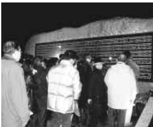
犠牲者への思いを胸に

犠牲者追悼之碑に 2700人の皆さんが献花 西宮震災記念碑公園には、地震発生時刻の午前5時46分から午後4時まで約2700人の皆さんが訪れました。1082人の震災犠牲者の名前を刻銘した追悼之碑の前に、犠牲者の方々をしのび、献花をされました。