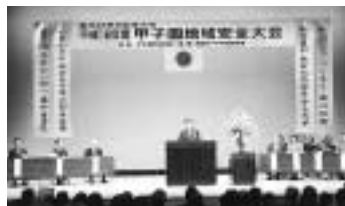
甲子園防犯協会の地域安全大会

設立以来、50年の永きにわたり地域社会の健全発展をめざし活発な運動を展開。自主防犯意識の啓発や防犯灯の設置維持管理、青少年の健全育成、暴力団等排除運動、薬物乱用防止活動の推進など、安全で安心して暮らせるまちづくりに寄与