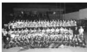
武庫川女子大学附属中学校・高等学校マーチングバンド部