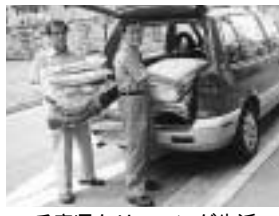
兵庫県クリーニング生活衛生同業組合西宮地区