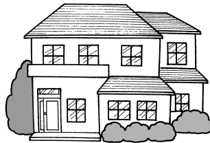
緑のあるまちなみに

市は、緑豊かなまちづくりに向けて、民有地の緑化助成制度を設けています。問合せは花と緑の課(〒628567六湛寺町10-3市役所本庁舎8階)0798-353682へ。