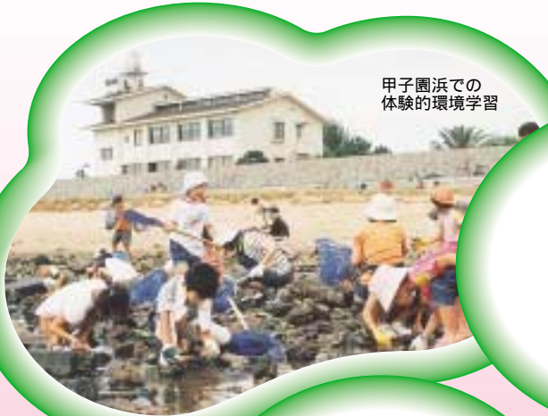
甲子園浜での体験的環境学習

市は、昨年12月に「環境学習都市」を宣言しました。各世代が継続的に自主的な環境学習や活動ができる仕組みをつくり、市民・事業者・行政が一体となって環境にやさしいまちづくりに取り組みます。