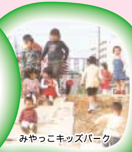
みやっこキッズパーク

市の環境学習に関する主な取り組みのひとつに、「地球ウォッチングクラブ・にしのみや(EWC)」があります。EWCは市が1992年に始めた、市内小学生を対象に行っているエコカードを活用した環境学習活動です。