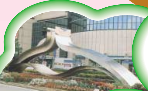
平和モニュメント「平和の交響」

みやっこキッズパーク(芦原町7-32)は、昨年11月にオープンしました。小山や小川などがあり、青空の下、自由にのびのび遊べます。子どもたちや市民の皆さんと一緒につくりあげていく冒険遊び広場です。