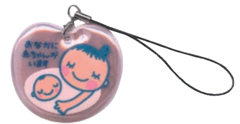
マタニティストラップ表面