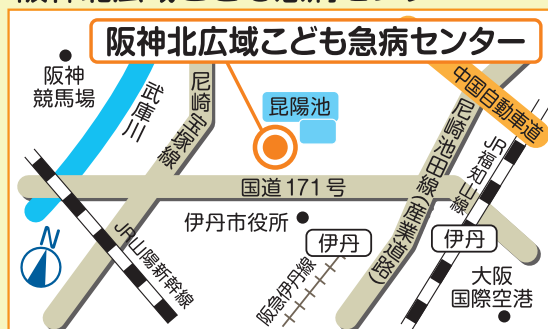
阪神北広域こども急病センター