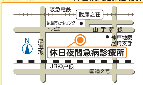
(公財)尼崎健康医療財団 休日夜間急病診療所