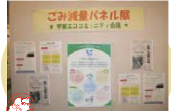
ごみ減量パネル展