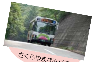
さくらやまなみバス

より詳しい情報はホームページをご覧ください。 西宮市ホームページ： http://www.nishi.or.jp/