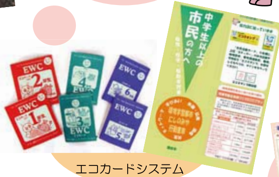
エコカードシステム