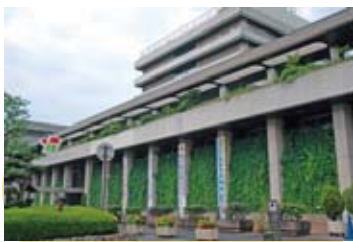
緑のカーテン（市役所）