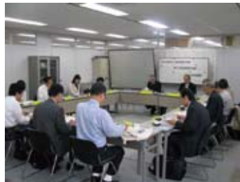
参画と協働による会議