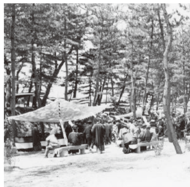
夙川公園(夙川河川敷緑地)の竣工式典の様子(昭和12年)。この頃は松林だった