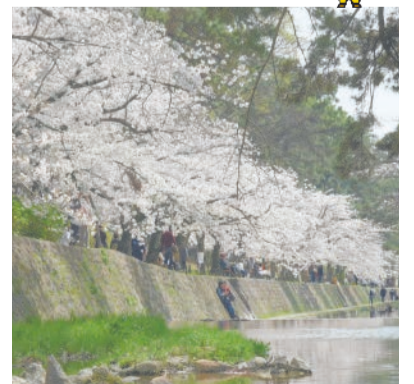
夙川ではソメイヨシノを中心に約1700本の桜が咲き誇る