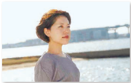
いどがわ いこ 作家 井戸川 射子さん

関西学院大学社会学部卒業 『する、されるユートピア』で第24回中原中也賞、 『ここはとても速い川』で第43回野間文芸新人賞、 『この世の喜びよ』で第168回芥川龍之介賞を受賞 趣味は読書と散歩