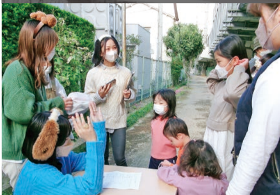
甲南大学地域貢献サークル学生との交流 深津自治会推進委員会