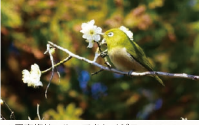
▲甲東梅林へやってきたメジロ

桜と並んで西宮市を彩る花の一つが梅の花です。私が梅の花を大好きな理由は、極寒の時期にもかかわらず美しく花を咲かせ、春の始まりを知らせてくれるからです。桜であれば、暖かい日が続くことに続き開花しますよね。これはこれで分かりますが、梅は寒は耐えぬのに開花をする、この趣深さが、梅の魅力なのだろうと思います。