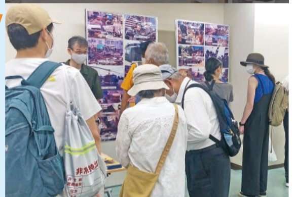
阪神・淡路大震災パネル展示 仁川町2丁目自治会