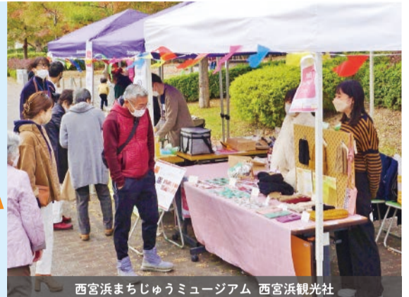
西宮浜まちじゅうミュージアム 西宮浜観光社