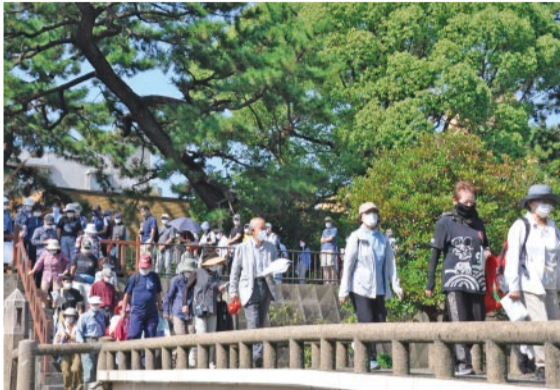
橋めぐりウォーキング 香櫨園コミュニティ協議会

毎月10・25日発行/西宮市役所：〒662-8567 六湛寺町10-3 ☎0798・35・3151(代表) 編集/広報課 ☎0798・35・3400 配布/シルバー人材センター ☎0120・72・4833 《推計人口：48万4129人 世帯数：21万8936世帯/令和5年(2023年)1月1日時点》