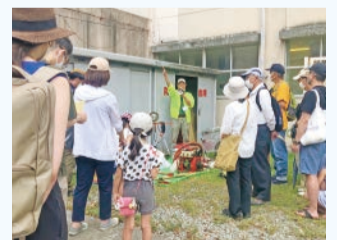
▲「防災・避難所巡り」スタンプラリーでの防災倉庫紹介の様子

学校や消防団等への協力依頼がしやすかったです。また、子供が楽しんで避難訓練をできる取組をしたかったのですが、自治会の財源だけでは実施が難しかったので、助成金があって助かりました。幅広い世代と一緒に災害時の避難経路を確認できてよかったです。