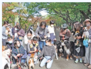
▲夙川オアシスロードで開催した「わんわんパレード」の様子

資金のサポートも助かったのですが、何よりこれまで市にお願いするのは敷居が高いと思っていたことを、未来づくりパートナー事業として実施することで気軽に相談できました。香櫨園地区の各種団体からも協賛いただき、改めて地域の温かさを感じました。