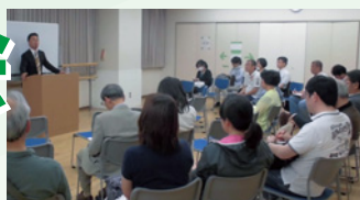
昨年の市政報告・広聴会の様子

市は、市長が市民の皆さんへ行政課題について説明し、ご意見やご質問をお聴きする「市政報告・広聴会」を開催しています。昨年度は春・秋期に各20回開催、延べ860人に参加していただきました。