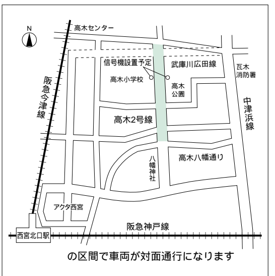
この区間で車両が対面通行になります

現在、北行き一方通行規制になっている、高木2号線の高木八幡通りから武庫川広田線北側までの区間について、12月3日午後1時から同規制を解除し、車両は対面通行になります。対面通行になることにより、高木小学校正門前に信号機を設置を予定しています。この道路は児童の通学路であり、小学校の正門や横断歩道もありますので、車両の運転には十分注意していただくようご協力をお願いします。