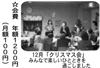
12月「クリスマス会」みんなで楽しいひとときを過ごしました