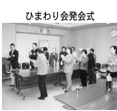
ひまわり会発会式

「ひまわり会」会費について 正会員：年額1,200円(月額100円) 賛助会員・個人：年額1,200円(月額100円) 賛助会員・団体：年額5,000円 ※正会員：現在、介護されている方もしくは介護の経験がある方 ※賛助会員：ひまわり会の主旨に賛同し、協力いただける方