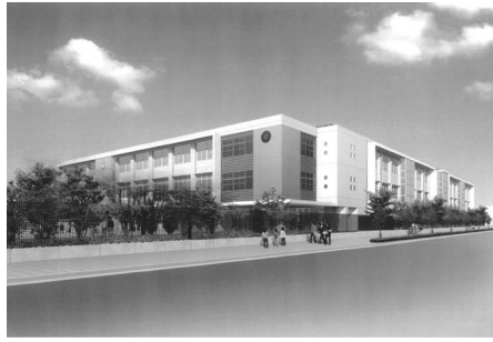
津門小学校校舎等の完成予想図

老朽化した津門小学校の校舎の建て替え事業を平成17年度から着手しています。19年度は北・東校舎の新築工事を行い、20年度には運動場の整備を行います。新たに生まれ変わる北・東校舎では、1階の北東部分に吹き抜けのある玄関を設けて、学校の顔とし、エレベータを設置してバリアフリーを実現するほか、屋上緑化など環境に配慮した校舎になります。