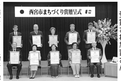
受賞された皆さん

市は「平成18年度西宮市まちづくり賞」の受賞者を決定し、3月8日に贈呈式を行いました。