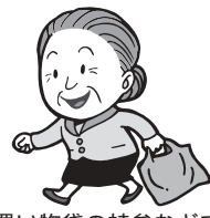
買い物袋の持参などでごみを減らしましょう