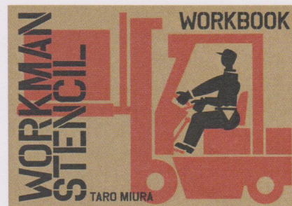
<特別展示1>《ワークマン ステンシル》 三浦太郎

申込方法：8月25日(月)午前9時より電話(0798-33-0164) にて受付開始