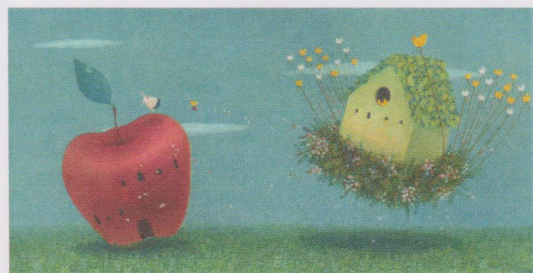
<特別展示2>《いちばんたいせつなともだち》 刀根里衣