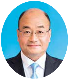
副議長 菅野 雅一 (会派・ぜんしん)