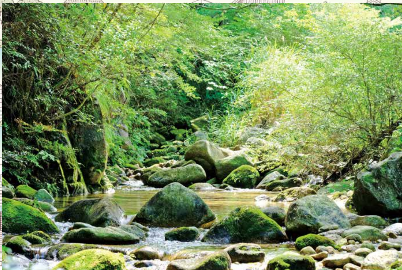
仁川の溪流(仁川広河原)