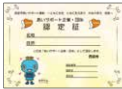
あいサポート企業・団体認定証

答 共生のまち実現に向け、あいサポート運動でのあいサポート養成や企業等への働きかけのほか、関連団体との啓発イベント開催等に取り組んでいる。▼その他の質問 西宮市市施行100周年記念事業 ほか (質問時間45分)