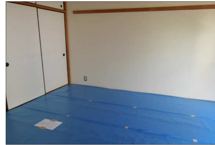
●和室（1） ※畳はシートで保護しています。