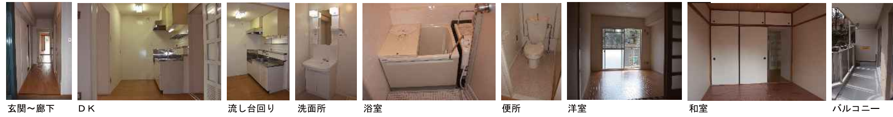
玄関～廊下 DK 流し台回り 洗面所 浴室 便所 洋室 和室 バルコニー