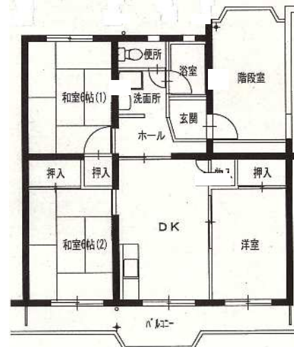
● 3DK : 58㎡ (3号棟)