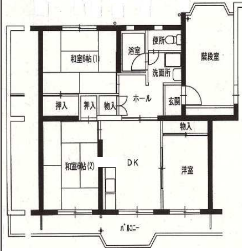
● 3DK : 62㎡ (2号棟)