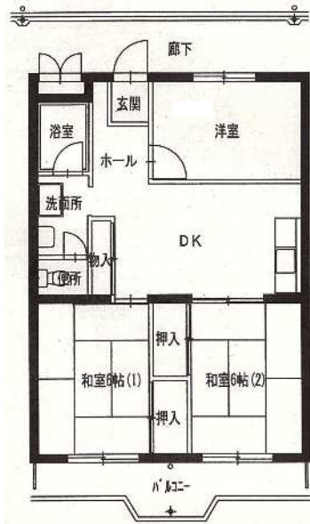
● 3DK : 58㎡ (1号棟)