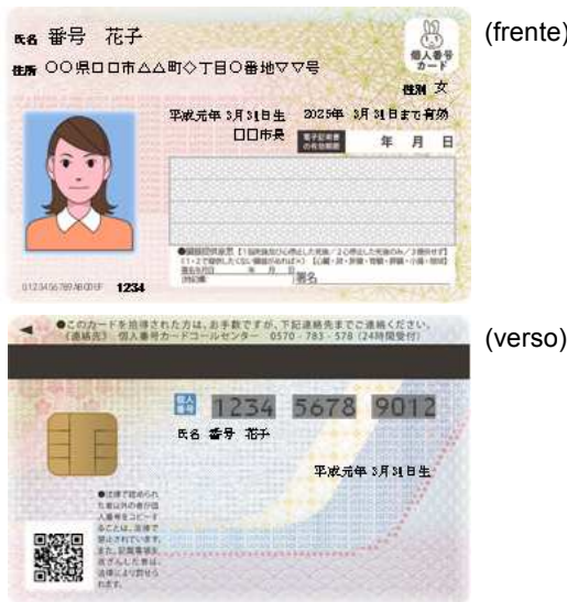
[Cartão com o Número Individual ( Kojin Bangō Card )]