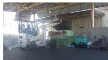
供給コンベヤへの投入