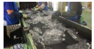
手選別コンベヤでの作業