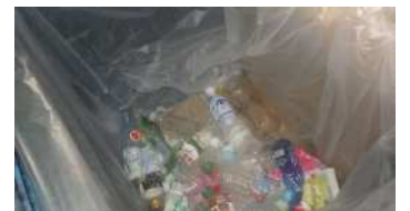
選別された不適物(パル付のもの)