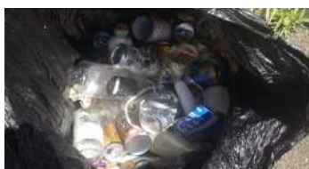
選別された不適物(空缶等)