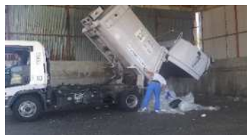
受入ヤードへの搬入