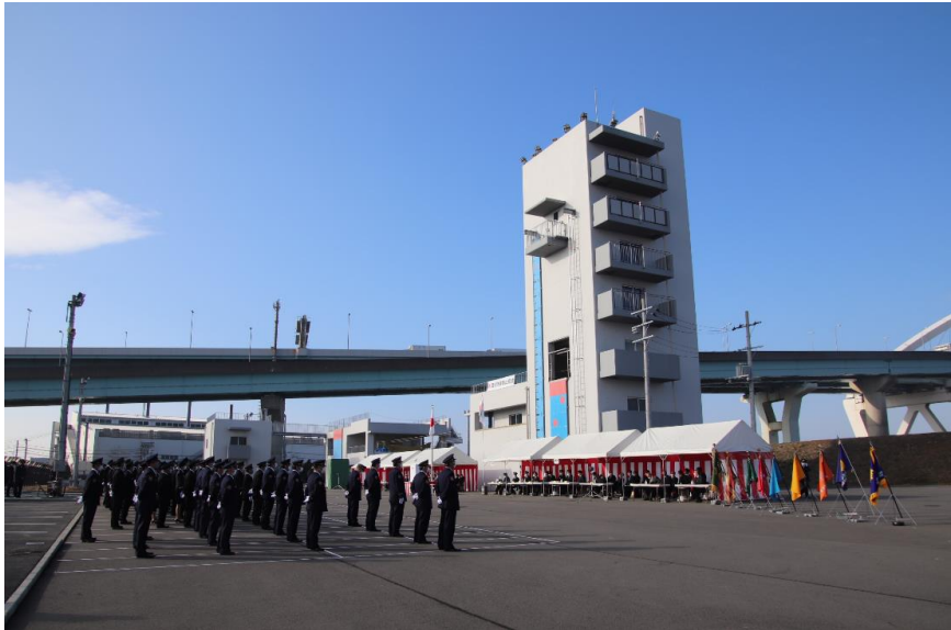
令和5年 西宮市消防出初式