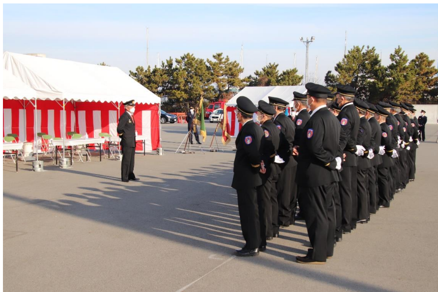
令和4年 西宮市消防出初式