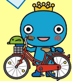
西宮市キャラクター みやたん