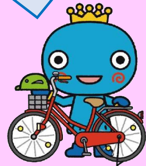
西宮市キャラクター みやたん