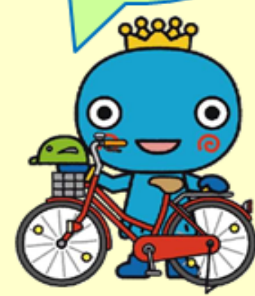
西宮市キャラクター みやたん