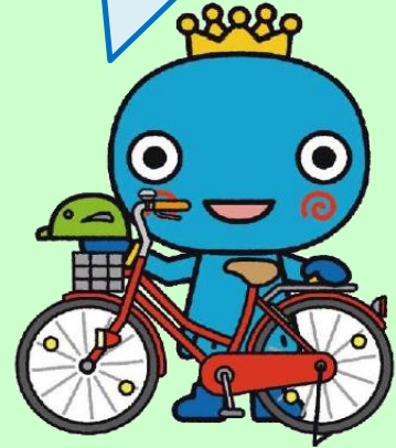
西宮市キャラクター みやたん