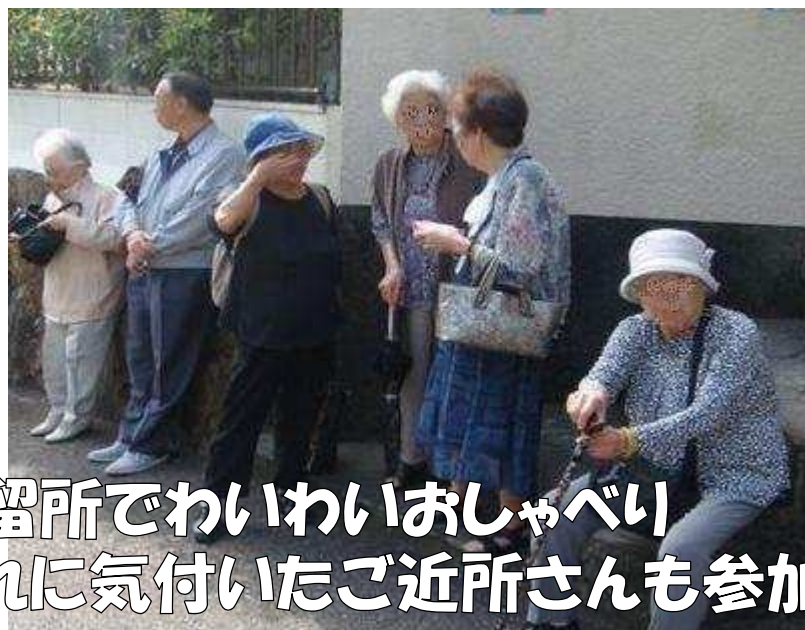
停留所でわいわいおしゃべり それに気付いたご近所さんも参加♪