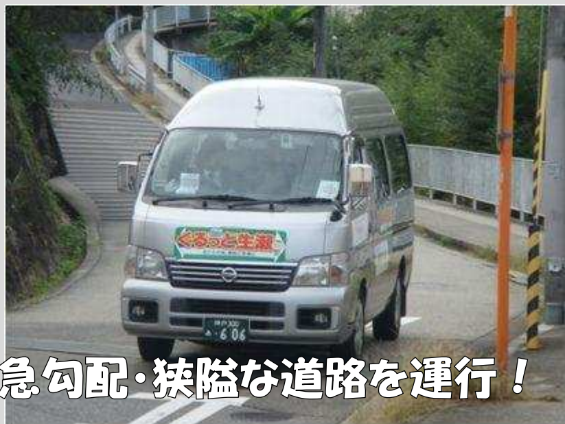
急勾配・狭隘な道路を運行！