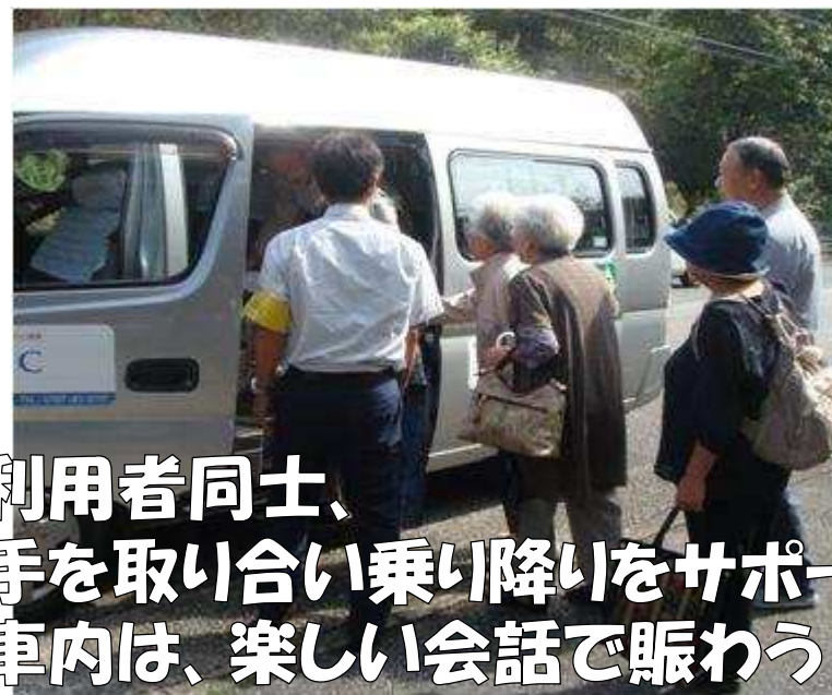
利用者同士、 手を取り合い乗り降りをサポート 車内は、楽しい会話で賑わう♪