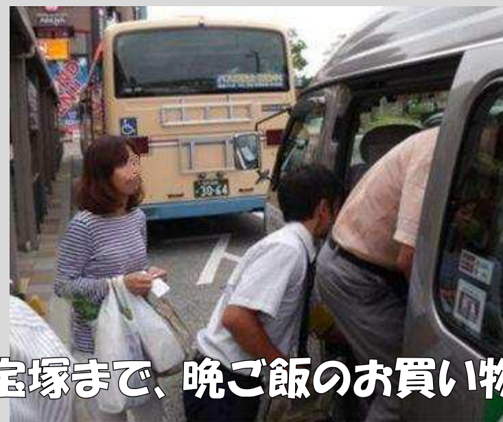
宝塚まで、晩ご飯のお買い物！