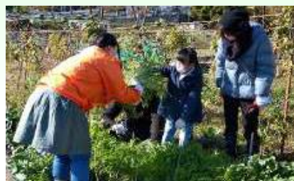
図 6-3 冬野菜の収穫体験の様子 (パートナーシッププログラム)

環境目標の実現に向け、事業者及び市民団体等の参画と協働による取り組みを促進するため、「環境学習都市にしのみや・パートナーシッププログラム」を募集しています。認定された事業者等のプログラムについては、市広報媒体への掲載やエコカード・エコスタンプシステムとの連携などの支援を行います。