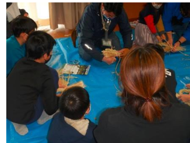
図 6-1 エココミュニティ会議でのしめ縄作りの様子

地域に根差した環境活動の輪を広げるため、各地域で「エココミュニティ会議」の設置が進んでいます。同会議は、平成 17 年度（2005 年度）に学文地域で初めて発足して以降、順次増え続け、令和 3 年度（2021 年度）では市内 21 地域で設置されています。市は、同会議への助成や必要に応じた支援を行うとともに、各地域に設置された同会議が一堂に会し、情報交換を行う交流の機会を設けています。