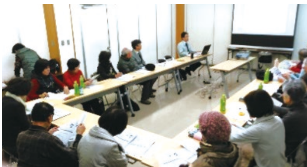
西宮市環境衛生協議会の巡回相談会

・市民を対象に、地球温暖化防止、ごみ減量、生物多様性などをテーマとした勉強会や巡回相談会、講演会などを開催し、市民の自発的な環境活動を促進しています。