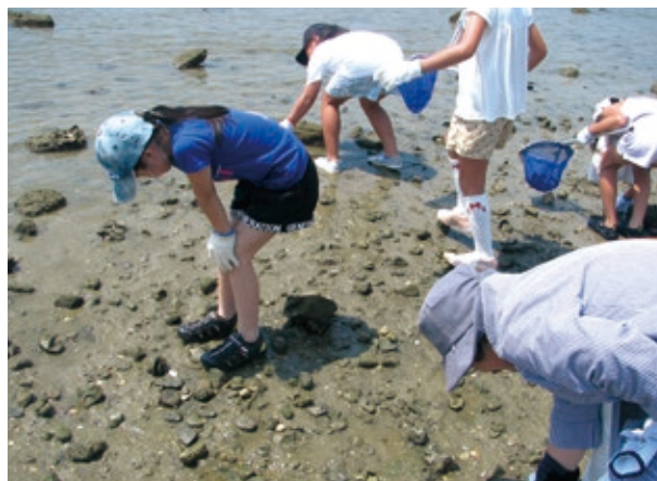
エココミュニティ会議の活動