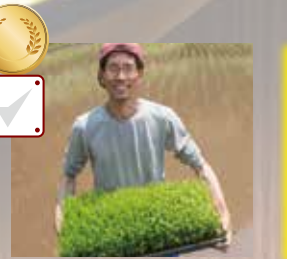
田んぼで稲を作ったり、薪を山から切り出したり、自然とともに生きる生活がしてみたい。