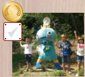
家や学校の回りにいる生きものを観察してみる。

山・川・海の自然に恵まれた西宮。そこに住むたくさんの生きものたちを守るための取り組み。さあみんなはできているかな