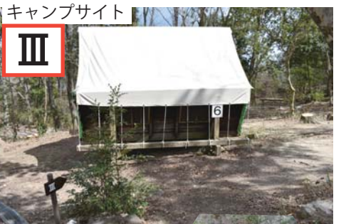
「I」と「III」は家族向け常設テント 「II」はグループ向け常設テント