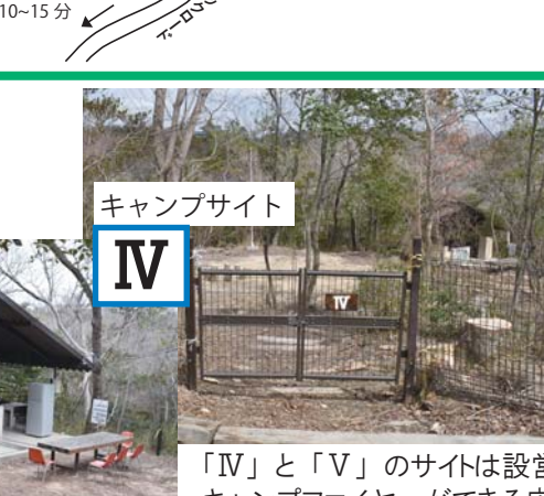
「IV」と「V」のサイトは設営テントのエリア、 キャンプファイヤーができる広場があります。

申込みは 西宮市立 甲山自然環境センター 市内の方：6ヵ月前から 市外の方：5ヵ月前から お電話ください