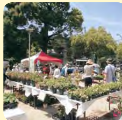
運営：北山緑化植物園 市民ガーデンセンター