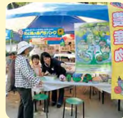
運営：兵庫県阪神南県民局 西宮土木事務所