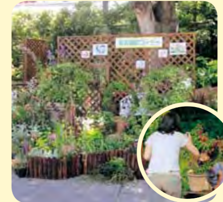
出展：植物生産研究センター 花工房