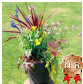
甲子園一番町グリーンクラブ 福岡 泰子