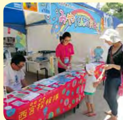
運営：西宮観光協会 西宮市 観光振興課