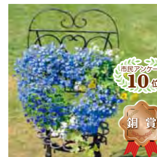
甲子園一番町グリーンクラブ 鯉