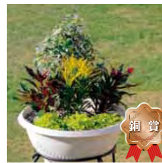
田代町自治会 篠原 伸廣