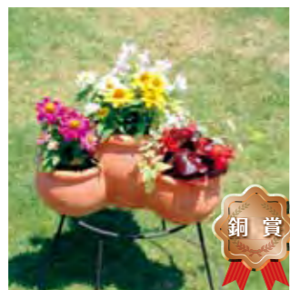
甲子園短期大学 園芸部A