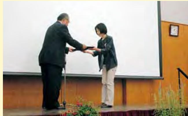
ガーデンコンペ 市長賞・銀賞 受賞者への表彰