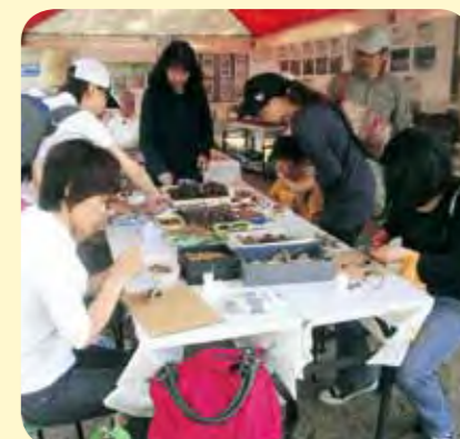
運営：NPO 法人 こども環境活動支援協会(LEAF)