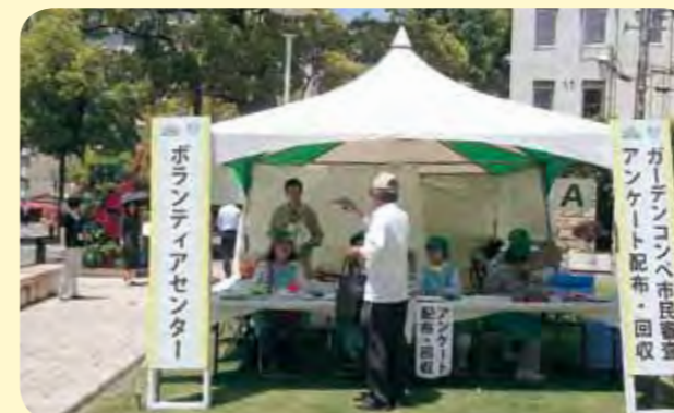
運営：西宮市花と緑のまちづくりリーダー