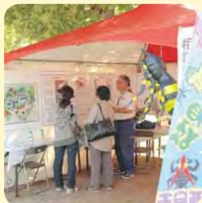
運営：西宮市 環境衛生課