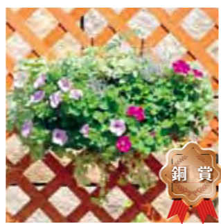
甲子園一番町グリーンクラブ 藤木 和子