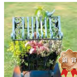
甲子園一番町グリーンクラブ 岸 美樹