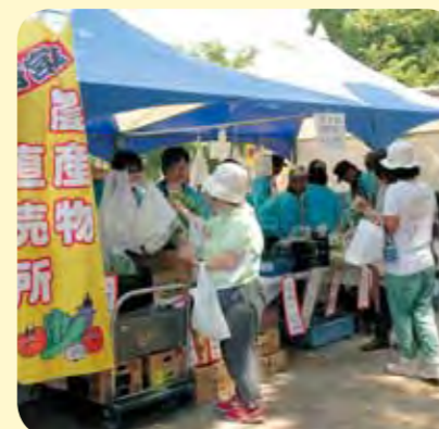
運営：西宮市都市農業推進協議会 西宮市 農政課