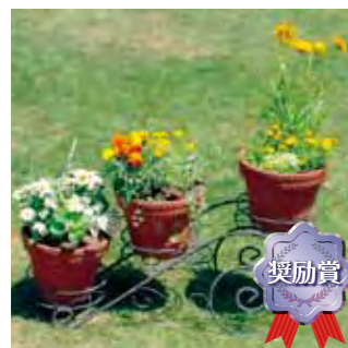
甲子園短期大学 園芸部A