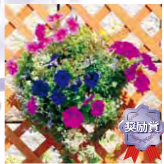
甲子園一番町グリーンクラブ 岸 美咲帆