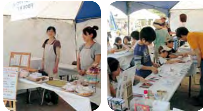
運営：西宮流（にしのみやスタイル）