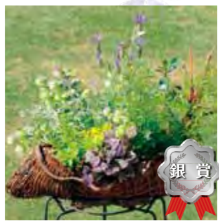
甲子園一番町グリーンクラブ 岸 美咲帆