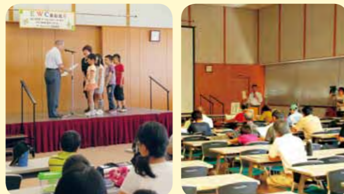
運営：西宮市 環境学習都市推進課 NPO 法人子ども環境活動支援協会 (LEAF)