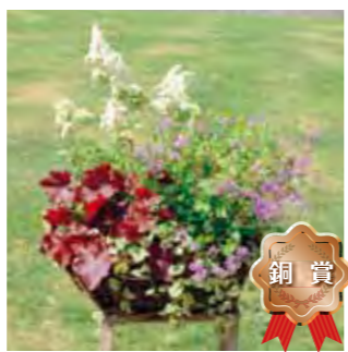
甲子園一番町グリーンクラブ 藤木 和子