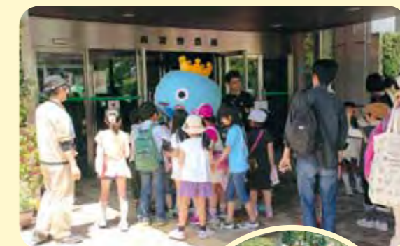
西宮市観光キャラクター みやたん