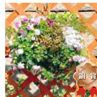
甲子園一番町グリーンクラブ 岸 美樹