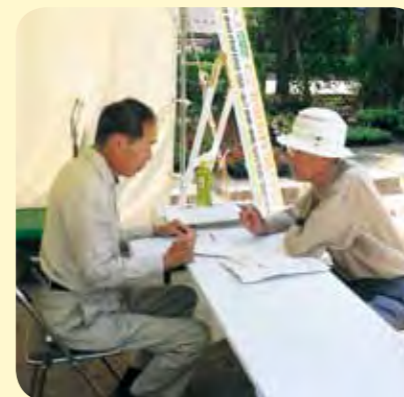
相談員：西宮造園緑化事業協同組合