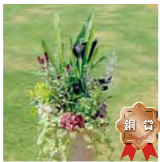
甲子園一番町グリーンクラブ 高岡 加奈