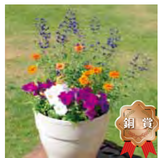
若楽園中学校 グリーンボランティア