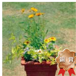
甲子園短期大学 園芸部B