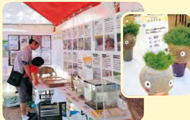
運営：西宮市 環境学習都市推進課 NPO 法人子ども環境活動支援協会 (LEAF)