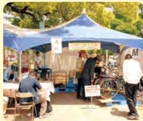
運営：西宮市 施設操作課 (リサイクルプラザ)・ 施設管理課

「まだまだ使える粗大ごみ 「もったいない」から始めよう リユース&チャレンジにしのみや25