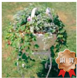
甲子園一番町グリーンクラブ 高岡 加奈