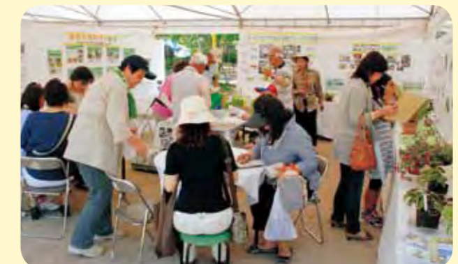
運営：ガーデンクラブ自主活動グループ