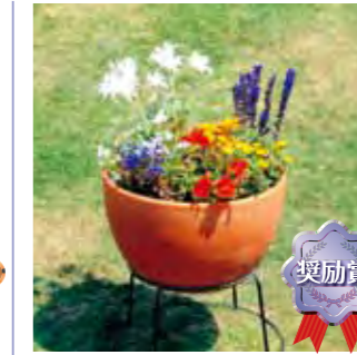
若楽園中学校 グリーンボランティア部 1年