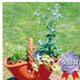
甲子園短期大学 園芸部B