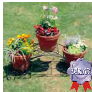
甲子園短期大学 園芸部A