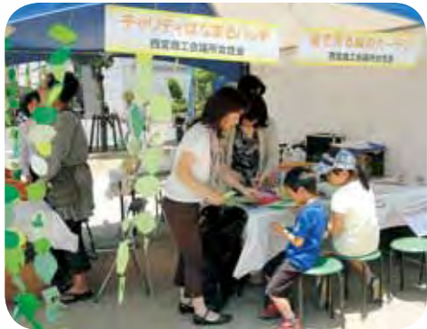
運営：西宮商工会議所女性会