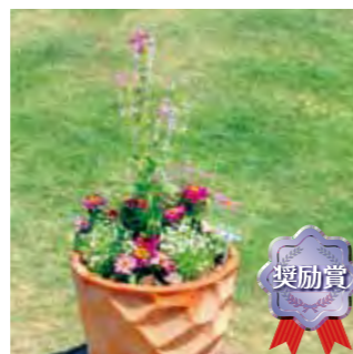
甲子園短期大学 園芸部B