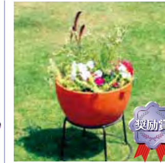
若楽園中学校 グリーンボランティア部 3年